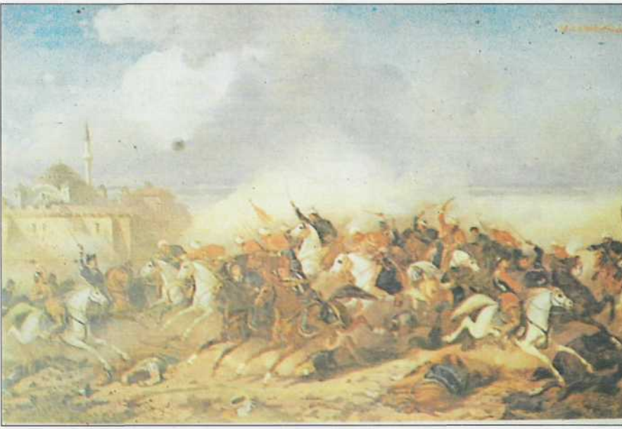
Osmanlılar'ın atlı komandolan akıncıların Belgrad kalesine hücumu.

ka birkaç, en az bir Balkan ve Avrupa dilini Evliyâ Çelebi'nin tabiriyle İnce konuşmak ", yani telaffuz yanlış yapmamak mecburiyetindedir. Zira ocağın çok önemli ikinci görevi, haber alma'dır . Dîvân-ı Hümâyûn (Osmanlı imparatorluk bakanlar kurulu), istihbarat görevlerinde, akıncı ve korsan subaylarını kullanır. Bunları, Avrupalı kimliğinde Avrupa ülkelerine salar.