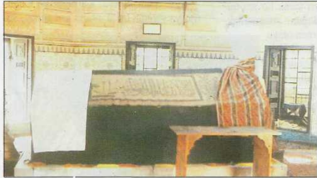
Kaanûnî Sultan Süleyman döneminde, Balkan fetihlerinde büyük yararlıklar gösteren ve iki defa Bosna Sancakbeyliği'ne getirilen Gazi Husrev Bey'in Saraybosna'daki camii ve türbesindeki sandukası.

maz. Ama 1683'e kadar daha epey önemli akın hareketine rastlanır. Bir veya birkaç akını anlatmak, konunun dışındadır.