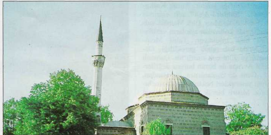
Üsküp'te Gazi İsa Bey tarafından yaptırılan İsa Bey Camii, 520 yıllık bir yapı.

Akınlarda büyük ganimet elde ediliirdi. Zaten ocağın gayesi, düşmanı iktisaden çökertip, muntazam Osmanlı ordusu için olgun meyve hâline getirmek veya Osmanlı'ya sataşmaktan alı-