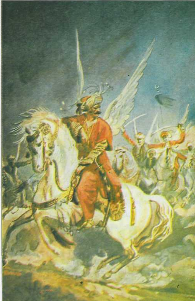
Merhum ressam Münif Fehim'in "Akıncılar" tablosu.

Akıncı Ocağı, çağdaş ordulardaki komando sınıfının karışığıdır. Atlı ve hafif silâhlı bir komando... Hareket yeteneği olağanüstü yüksek... Görevi, düşman ülkesini taramak, düş-